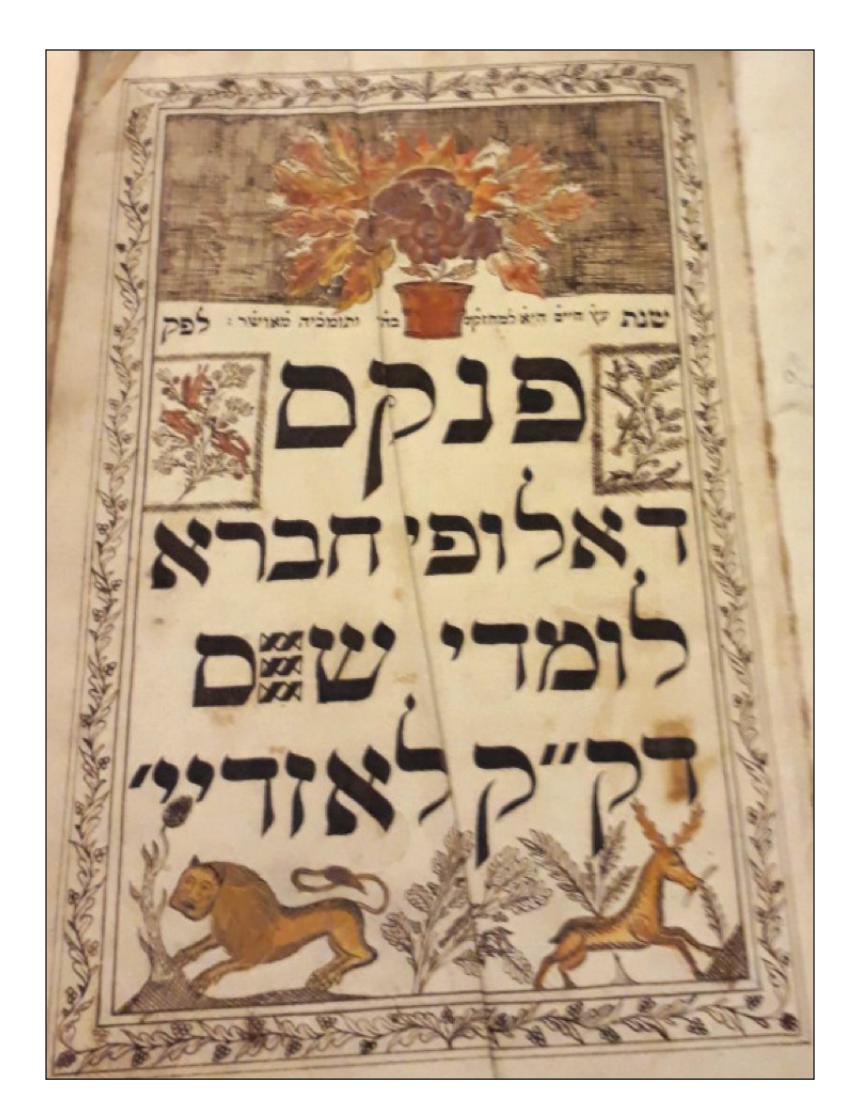
Pinkas (Communal Record Book) of the Hevra Lomde Shas (Learners of the Talmud Society) in Lazdijai, a town in southwestern Lithuania, 1836.