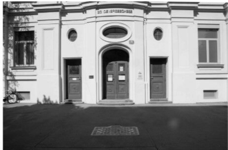
Stolperstein für jüdische SchülerInnen